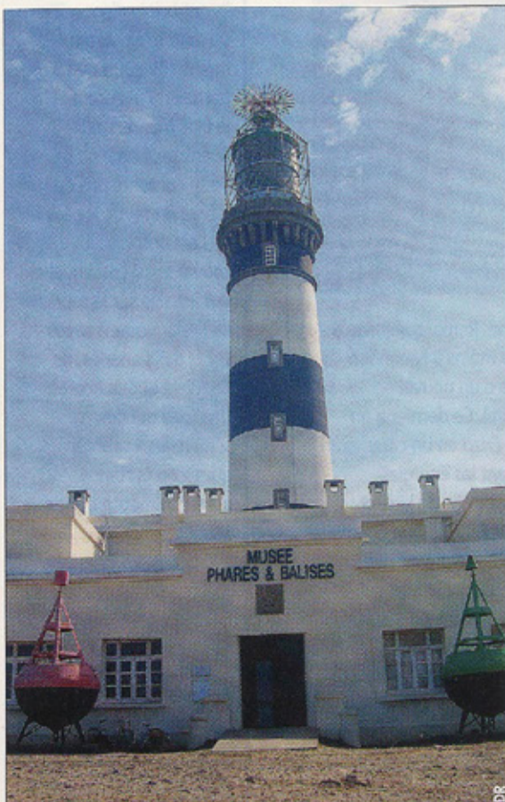
▲ Le musée des Phares et Balises est installé dans l'ancienne habitation des gardiens, au pied du phare.

Né de la planche à dessins de l'ingénieur Carcaradec et construit sur l'île d'Ouessant par l'entrepreneur brestois Tritschler, le phare du Créac'h a été mis en service en 1963, il y a 150 ans révolus. Pour célébrer cet anniversaire, le musée des Phares et Balises, qui se situe au pied du phare, propose une exposition dédiée au Créac'h et aux différentes innovations techniques dont il a bénéficié. Le phare du Créac'h est en effet un témoin privilégié des progrès réalisés dans le domaine des optiques, et il reste à ce jour le phare le plus puissant d'Europe avec une portée de 32 milles qui fait de lui la sentinelle de la pointe Bretagne. L'exposition évoque aussi la vie des gardiens et de leurs familles, ainsi que le développement de l'île. Elle est ouverte jusqu'au mois d'octobre 2014. Rens. : 02 98 48 80 70 ou www.pnr-armorique.fr .