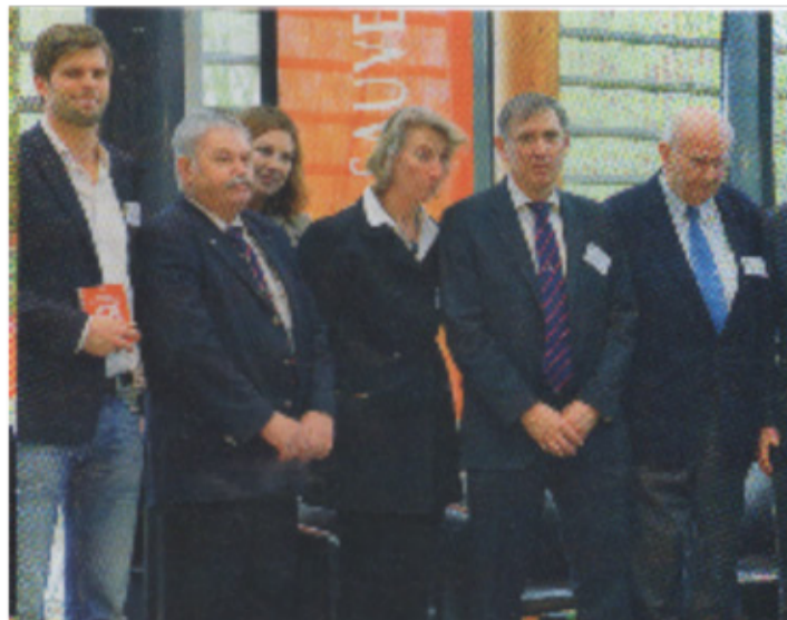
Les arrangements... à l'occasion de...