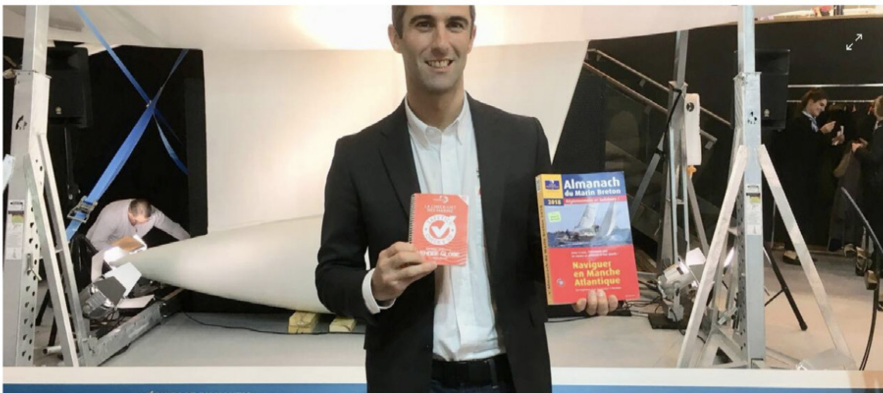
Armel Le Cléac'h, ici au dernier salon nautique de Paris, est le parrain du petit guide rouge de Safetics qui complète bien l'Almanach du marin breton dans le sac du plaisancier.

Le petit manuel de sécurité résistant à l'eau accompagne les marins depuis trois ans. Conçu sur le modèle des check-lists aéronautiques, il est désormais disponible en trois langues et dans une édition spéciale pour la prochaine Route du Rhum en novembre.