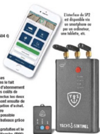
L'interface du SP2 est disponible via un smartphone ou par un ordinateur, une tablette, etc.

disponible à l'achat (504 €) sur la page en ligne de Yacht Sentinel ou directement auprès des distributeurs (dont la liste figure sur le site internet http://www.yacht-sentinel.com ). Un de ses points forts réside dans le fait qu'il n'y a pas besoin d'abonnement ni de carte Sim, car les coûts de communication sont inclus dans les deux premières années et sont ensuite de 60 € par an sans obligation d'achat. Sa couverture cellulaire est mondiale, et il est possible de gérer jusqu'à cent bateaux grâce à l'appli. Les mises à jour sont gratuites et le système est bien sûr étanche (IP66) et peut fonctionner sur du 12 V, 24 V ou 36 V.