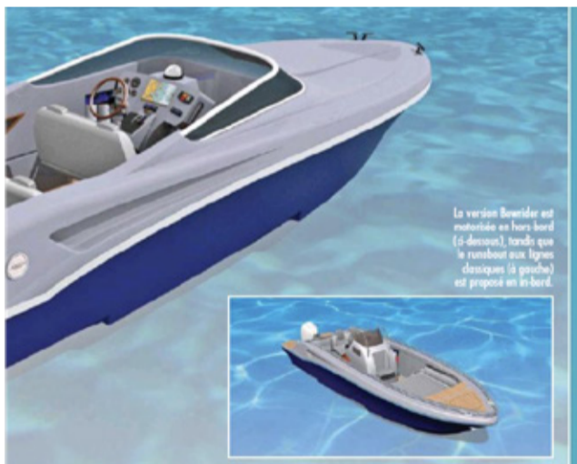
La version Bowrider est motorisée en hors-bord (à droite), tandis que le runabout aux lignes classiques (à gauche) est proposé en in-bord.

Safetics, à l'origine du guide de poche waterproof La Check-List des Marins , propose désormais de personnaliser le guide aux couleurs d'entreprises ou de clubs nautiques. Il a également rejoint la liste des produits solidaires vendus au sein de la boutique des Sauveteurs en mer, via le site www.laboutiquesnsm.org ou directement par les stations SNSM sur le terrain.